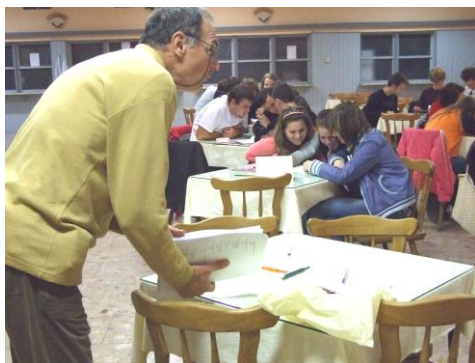
Zúčastnili sme sa kvízu o prírodných krásach

Slovenska. Bolo tam veľa zaujímavých otázok, ale nie na všetky sme vedeli odpovedať, pretože nie všetko, čo tam bolo, sme sa učili v škole, ale aspoň si to budeme pamätať do budúcnosti. Výhercovia získali zaujímavé ceny, a preto vám odporúčam sa do tohto kvízu zapojiť aj na ďalší rok. Nič nestratíte, len získate.