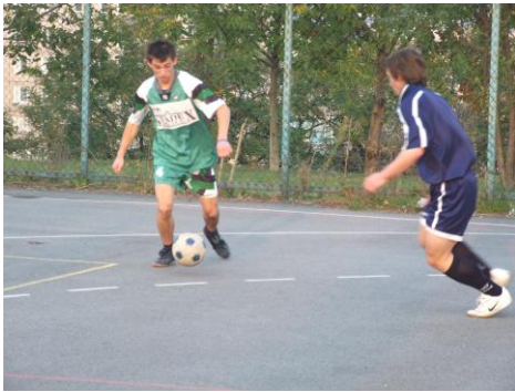
Kvíz – Z každého rožku trošku