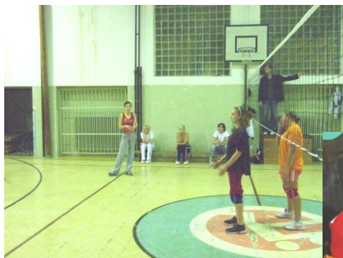
Volejbalový turnaj dievčat

28.10.2008 Súťaže v silových disciplínach na ihrisku ŠI na Medickej 2 v Košiciach