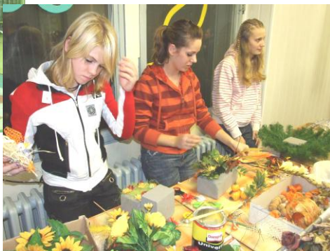
Výstava prác členov krúžku Šikovných rúk