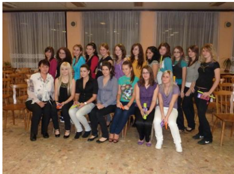
Imatrikulácia – naše prváčky