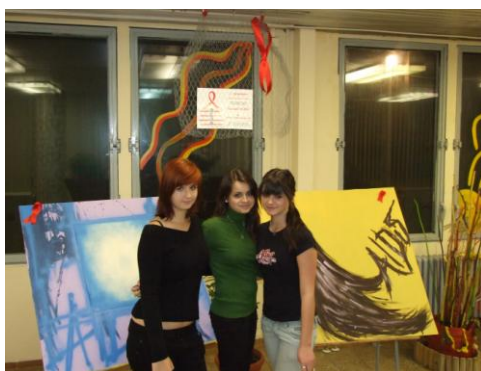
Červené stužky - Deň boja proti AIDS