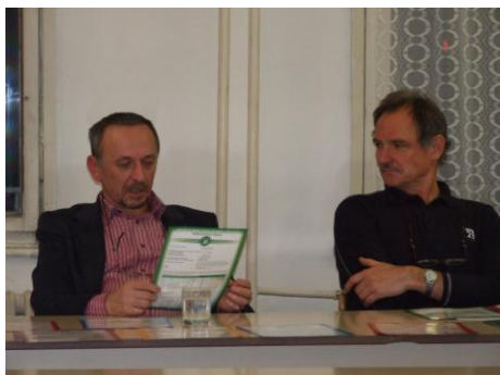
Štúdium na fakultách UPJŠ