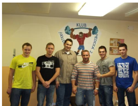
Beseda s majstrom sveta v kulturistike