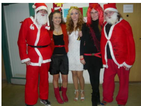
Priniesli nám mikulášske baličky