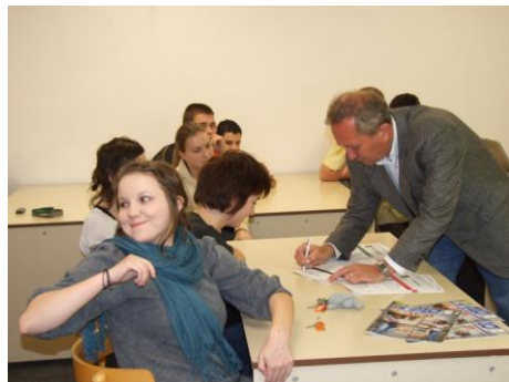
Štúdium na Technickej univerzite