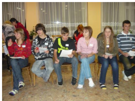
Volili sme svojich zástupcov