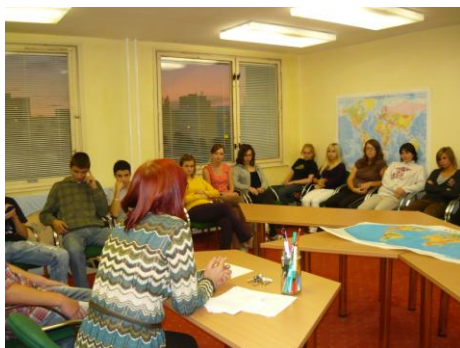
Týka sa to aj mňa? Boj proti drogám