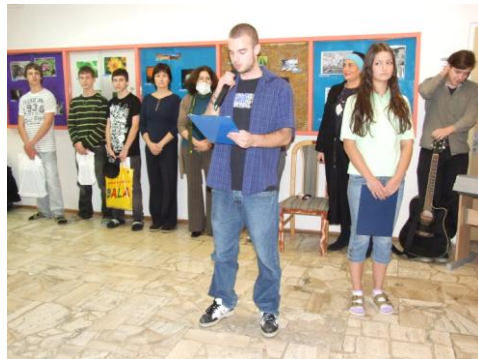
Vyhlasenie výsledkov fotosúťaže