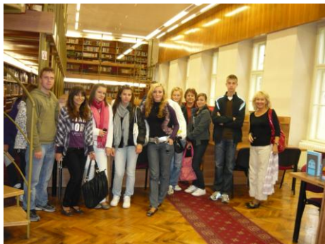
Exkurzia vo vedeckej knižnici